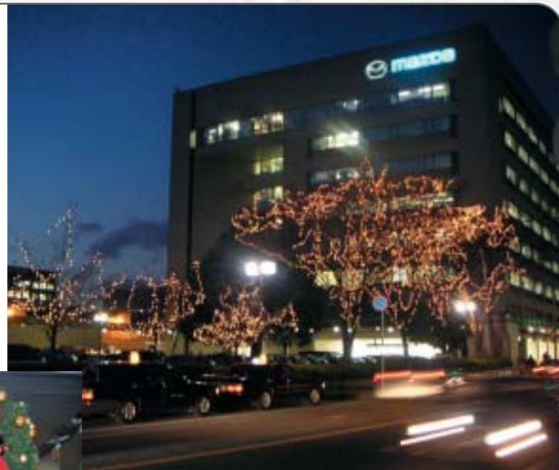
近隣の皆さんにも好評です。ライトアップは1月16日まで

一昨年は県道側の樹木4本のみだったイルミネーションを、2号館からマツダリビングまで続く13本に増やしました。より豪華になったイルミネーションが、仕事を終えた社員たちを暖かく照らします。