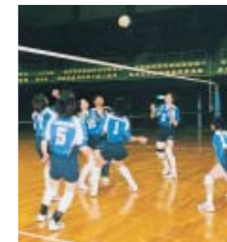
本番さながらの練習(マツダ体育館で)