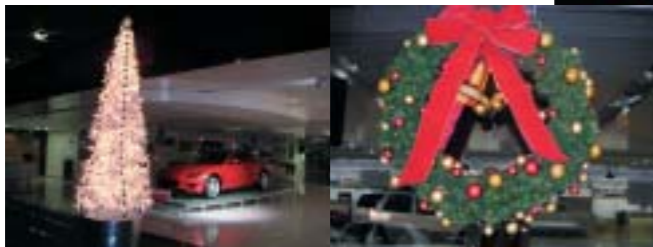
新しいロビーを華やかに彩るクリスマス装飾が12月25日まで展示されました